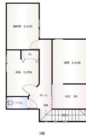
現況と間取りが異なる際は、現況有姿となります。