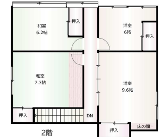
間取り図と現況が異なる際には、現状有姿となります。