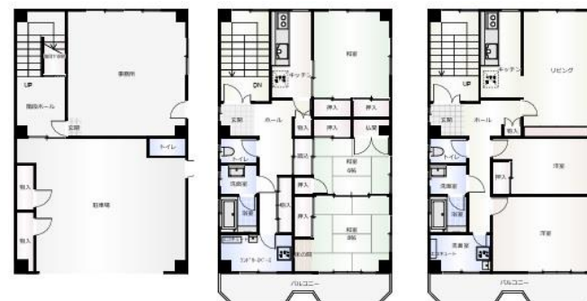
1階 2階 現況と間取り図が異なる際は、現状有姿となります。