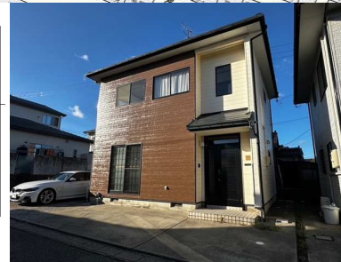
※現況と相違する場合は現況を優先致します