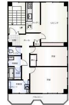
1階 2階 現況と間取り図が異なる際は、現状有姿となります。